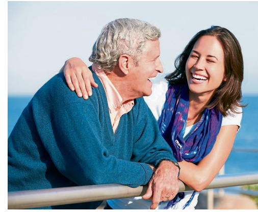
Gebraucht werden u. a. Personen, die ein paar Stunden pro Woche Zeit mit Senioren verbringen.

Für dieses Engagement brauchen Sie einen Führerschein. Zudem sollten Sie kommunikativ sein, gerne mit anpacken und keine Berüh-