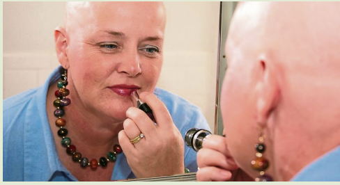
Alle Patientinnen nehmen aktiv am Seminar teil, das heißt, sie schminken sich selbst.

In den kostenfreien look good feel better -Kosmetikseminaren von „DKMS LIFE“ erhalten Krebspatientinnen Hilfe zur Selbsthilfe im Umgang mit den äußeren Veränderungen während der Krebstherapie. Professionelle, geschulte Kosmetikexpertinnen zeigen den Krebspatientinnen Schritt für Schritt, wie sie die